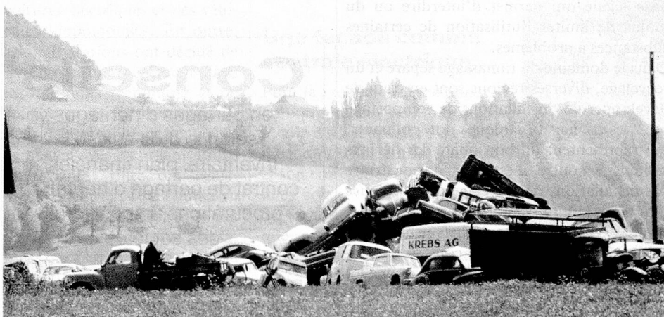
Loin des yeux, loin du cœur? L'assainissement des décharges inappropriées dure des années et provoque des frais énormes.

Outre ces usines d'incinération, où l'on brûle environ 80 pour cent des déchets urbains, nous ne disposons en Suisse que d'un petit nombre d'installations équipées pour la mise en valeur ou la transformation de cer-