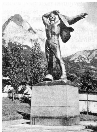
La Guerre (Monument aux défenseurs du pays, datant de 1941, à Schwyz)...