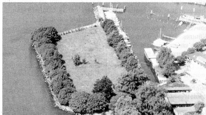
...et la Paix (Place des Suisses de l'étranger, lieu de rencontre, 1991).

vous donner ici des informations détaillées concernant les montants reçus sur les 20 comptes ouverts dans le monde entier pour la collecte de fonds; au cours de cet automne, toutes les Sociétés de Suisses de l'étranger