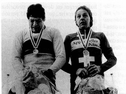
Pascal Richard, le roi suisse de la piste boueuse.