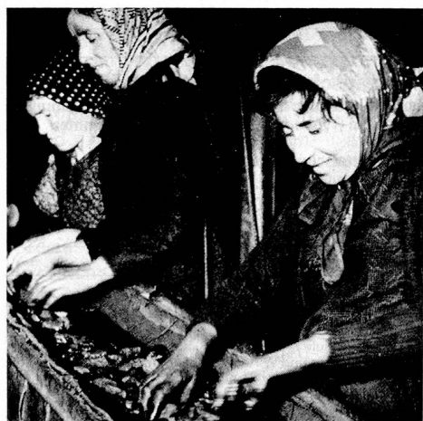
Femmes triant l'antracite, Valais 1947.