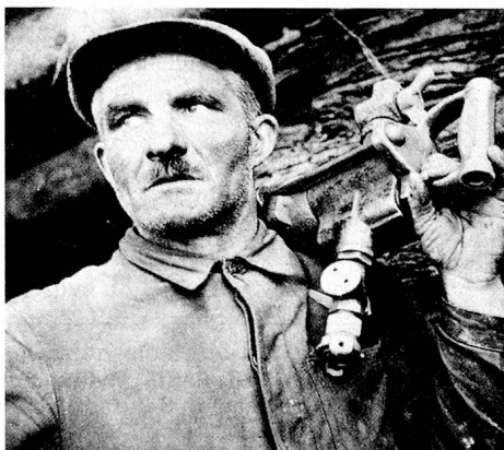
Mineurs, Valais 1947.

L'or est un métal qui sort de l'ordinaire. On en a découvert à Gondo, près du Simplon, à Calanda (mine du «Soleil d'or») près de Coire, au-dessus de Salanfe dans le bas