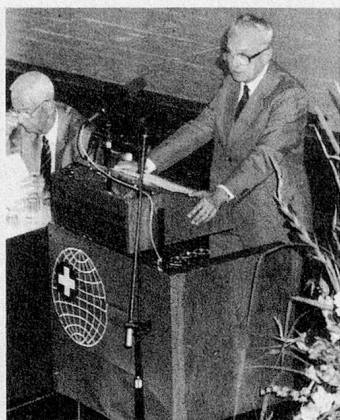
Le conseiller fédéral Léon Schlumpf, qui se retire à la fin de cette année, s'adresse aux Suisses de l'étranger.

Un autre point fort de l'assemblée plénière a été, pour tous les participants, le discours plein d'esprit et d'idées du conseiller fédéral Léon Schlumpf, qui se retire à la fin de l'année: il a souhaité une cordiale bienvenue aux personnes présentes, dans les quatre langues nationales.