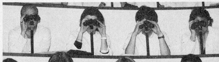
Pas seulement les futurs médecins devraient y regarder de plus près... (Des étudiants dans l'amphithéâtre de pathologie de l'Université de Berne).

Ecoles privées en Suisse , liste des écoles qui font partie de l'Association des écoles privées,