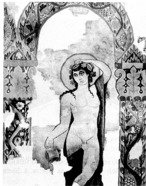
Le dieu de la vigne, personnage central de la tapisserie de Dionysos.

La salle où ce chef-d'œuvre est exposé – en