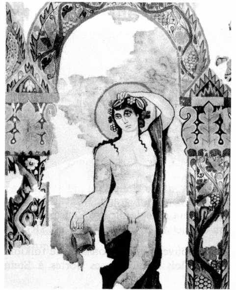
Le dieu de la vigne, personnage central de la tapisserie de Dionysos.

La salle où ce chef-d'œuvre est exposé – en