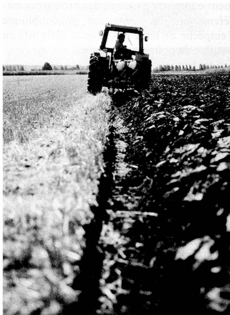
Paysan du plateau aux labours.

D'autre part, ce point de vue coïncide avec les intérêts des grands commerces de distribution et des associations de consommateurs, qui critiquent le protectionnisme agricole en revendiquant le droit pour chacun de «choisir son menu». Il est par exemple gênant que des spécialités de fromages étrangers soient renchériées à la frontière, que l'importation de vins soit contingentée et que l'Union suisse des paysans ait récemment demandé que l'on freine l'importation