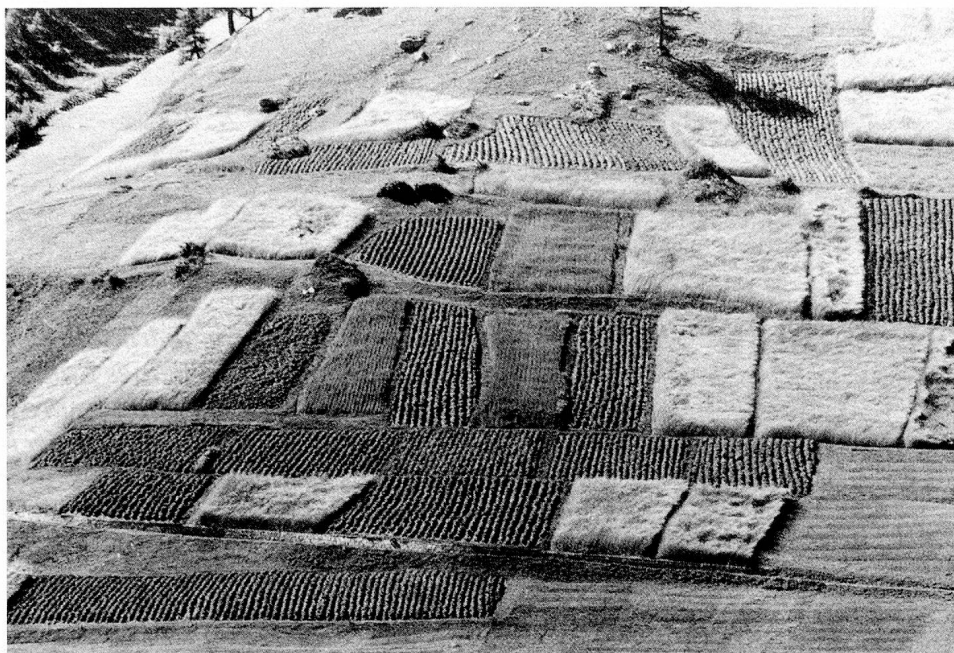
Les paysans de montagne doivent travailler leurs champs dans des conditions plus dures. Notre photo: Près de Ulrichen (VS).