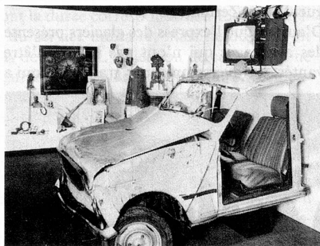
L'exposition «Le mal et la douleur» au musée d'ethnographie de Neuchâtel.