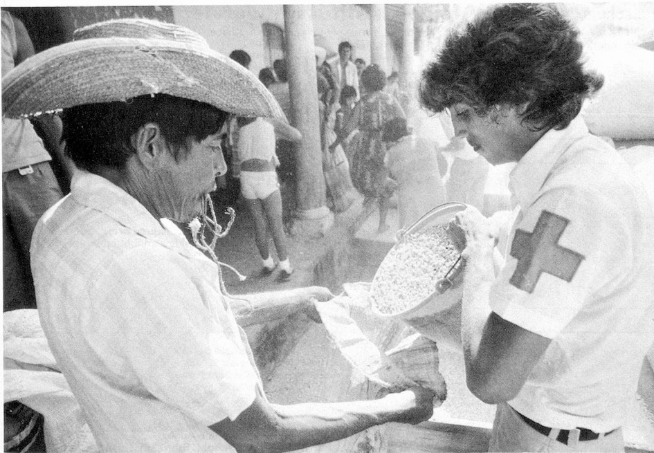
Distribution par le CICR de «frijoles», aliment de base de la population salvadorienne.

Il est vrai qu'il y a des raisons d'espérer que l'exclusion de la délégation gouvernementale sud-africaine (la Société de la Croix-Rou-