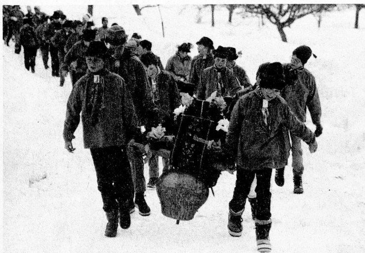
«Chalandamarz» – ein alter Brauch, mit dem die Engadiner Jugend alljährlich den Frühling einleitet.