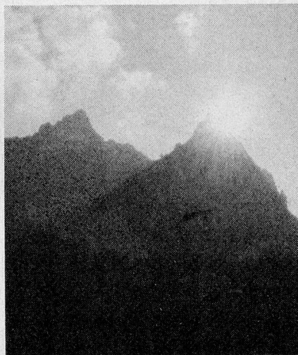
Photo des deux Mythen, SZ