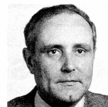
Pro: Flavio Cotti, Conseiller national, PDC, avocat et notaire, Locarno.

En d'autres termes, une fois membre de l'ONU, la Suisse se verrait placée devant les mêmes problèmes ou devant des choix fort semblables, par rapport à sa politique de neutralité , que ceux auxquels elle est confrontée aujourd'hui en tant que non-membre . Cette remarque est également valable en ce qui concerne les votes dans les principaux organismes de l'ONU. Aujourd'hui déjà, dans ses organisations spécialisées (par exemple à l'Unesco), dans la Conférence sur la sécurité et la coopération en Europe (CSCE) ou lors de sanctions de la Communauté économique européenne (CEE), elle décide en toute souveraineté d'une voie compatible avec sa politique de