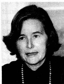
Elisabeth Kopp Conseillère fédérale