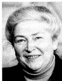
Esther Bühler Conseillère aux Etats, membre de la Commission des Suisses de l'étranger