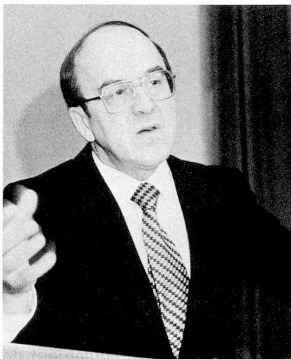
Notre hôte d'honneur, Monsieur Kurt Furgler

Le cadre aussi était original puisque c'est à la MUBA, foire fort connue de nos compatriotes de l'étranger, moins attrayante peut-être qu'un village typique suisse, mais tout aussi intéressante par les possibilités offertes de découvrir notre pays sous un autre as-