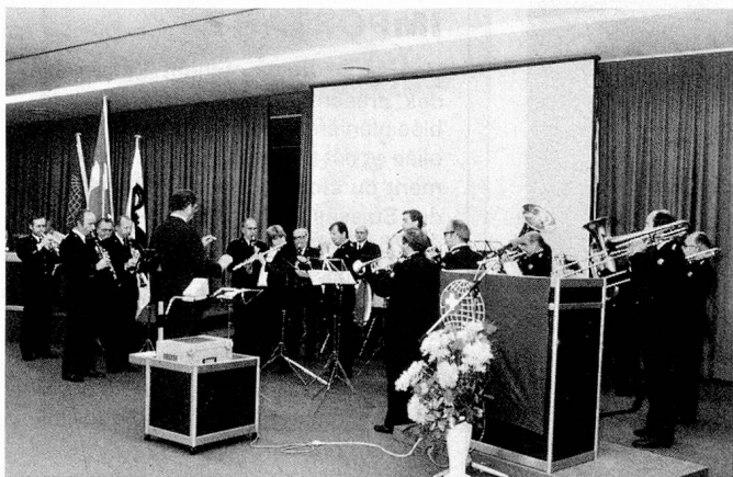
Vendredi matin... lors de l'Assemblée plénière