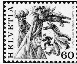
Schnabelgeissen, Ottenbach ZH