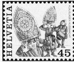
Klausjagen, Küssnacht a. R. SZ