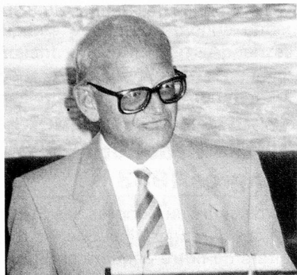
M. Alphons Egli, Conseiller fédéral.