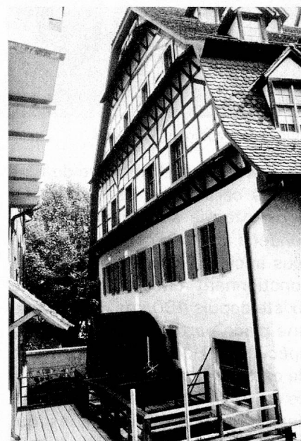
La roue hydraulique du Moulin à papier, Bâle.

loir mène au premier étage. On peut voir, dans la salle donnant au sud, un aperçu de l'histoire de l'écriture et de l'alphabet ainsi qu'une exposition sur les écritures non alphabétiques. Les salles situées à l'est et au nord révèlent au visiteur les plus anciennes écritures alphabétiques sémitiques ainsi que les écritures grecque et romaine, et la salle d'apparat couverte de boiseries des Gallician les écritures du Moyen Age. Un aperçu de l'évolution de l'écriture jusqu'à nos jours y est également présenté.