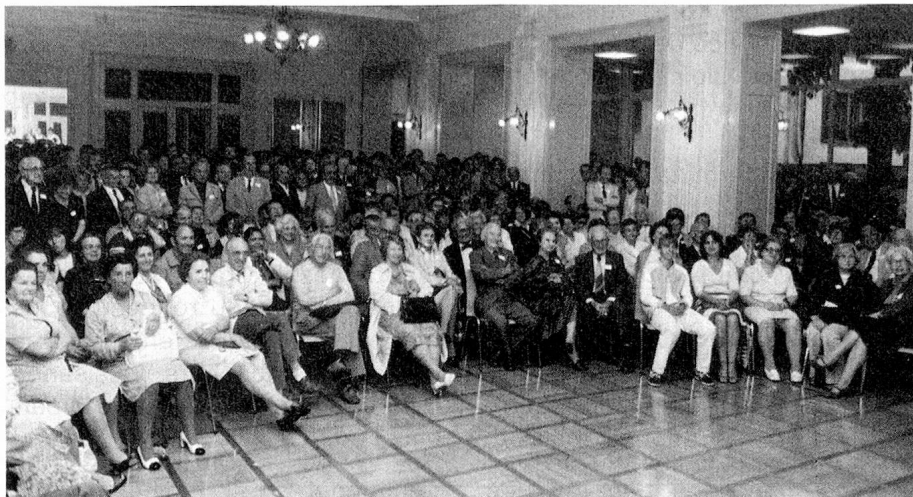
Pendant l'ouverture officielle.