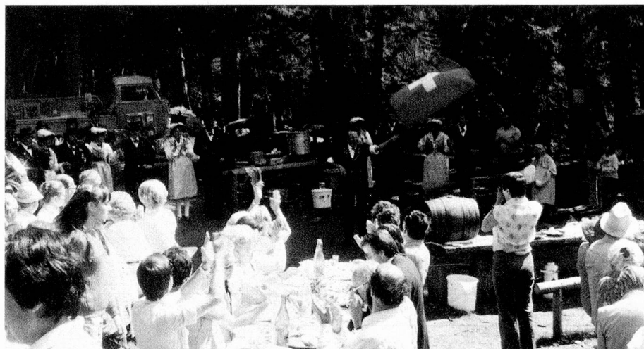
Un groupe folklorique agrémenté l'excursion du dimanche.

L'après-midi fut consacré à divers problèmes et avant tout au message du Conseiller fédéral Aubert qui rendit son auditoire attentif au travail de son Département, actuellement préoccupé par les relations de la Suisse avec l'ONU. Il défendit la thèse de l'interdépendance internationale toujours croissante, à laquelle la Suisse ne peut se soustraire, son adhésion à l'ONU s'avère nécessaire dans le cadre de la politique extérieure traditionnelle et pragmatique. Au début, les relations extérieures de