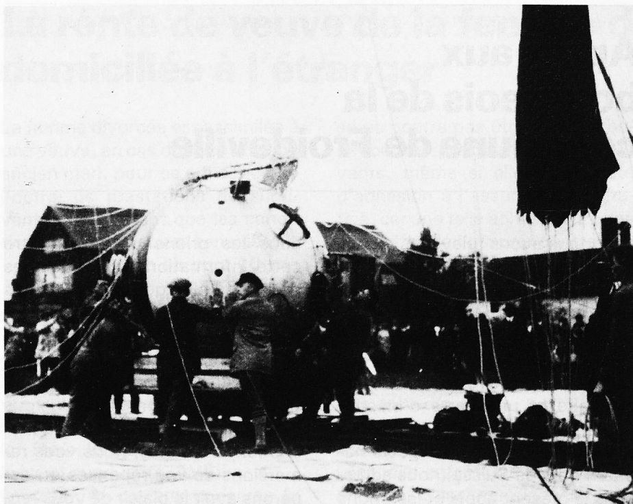
Le vol d'Auguste Piccard dans la stratosphère»

et dans un milieu extrêmement froid, n'a aucune chance de survivre. Faisant appel à un souvenir d'enfant, Auguste Piccard se mit à imaginer la construction d'une capsule hermétique et détachable comme solution à ces obstacles. La capsule en question était censée être catapultée dans la stratosphère depuis un ballon. Le 26 mai 1931, celle-ci fut parée pour un premier vol expérimental. Cet essai échoua en raison de vents très violents. Le lendemain, les préparations au départ furent à nouveau programmées mais le personnel au sol fit remorquer le ballon sans en avertir les deux pilotes, soit Auguste Piccard et Paul Kipfer. Ce départ «amateur» faillit engendrer une tragédie, la tempête de la veille ayant endommagé une pièce et provoqué une fuite importante. Les occupants parvinrent néanmoins mais non sans mal à éviter la catastrophe. Malgré tout, l'aventure ne faisait que commencer! En effet, une soupape mal fermée retarda la programmation du retour et il s'en fallut de