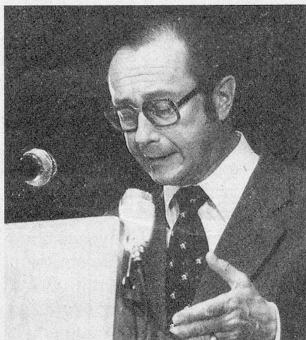
Pierre Aubert, Vice-président de la Confédération Département des Affaires étrangères

7 membres élus pour quatre ans par l'Assemblée fédérale (Chambres réunies)