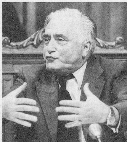
Georges-André Chevallaz Département militaire