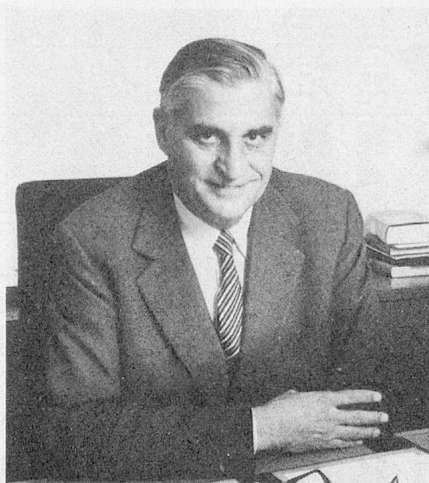
Fritz Honegger, Président de la Confédération Département de l'économie publique

autres désignations: Gouvernement (central), Exécutif