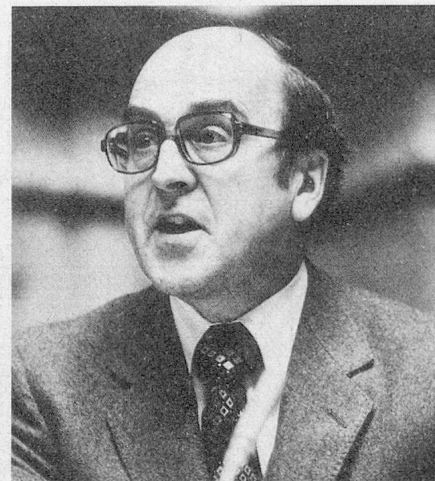
Kurt Furgler Département de justice et police