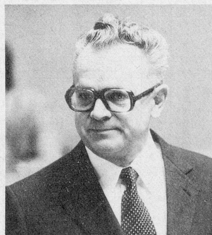
Léon Schlumpf Département des transports, des communications et de l'énergie

Nous venons d'apprendre que les Conseillers fédéraux MM. Honegger et Hürlimann quitteront le gouvernement à la fin de cette année.