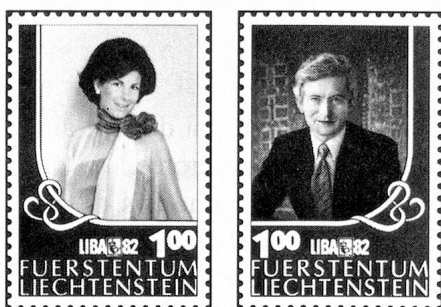
Timbres spéciaux «LIBA '82»