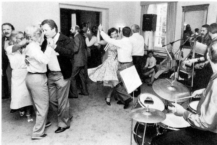
On danse à Bad Attisholz dans la bonne humeur

une question de folklore: «J'admire toujours le courage de ces personnes, qui quel que soit leur âge ou leur classe sociale, vont se construire une nouvelle existence à l'étranger et y développer une activité indépendante qu'ils n'auraient peut-être pas pensé, auparavant, pouvoir mener à bien».