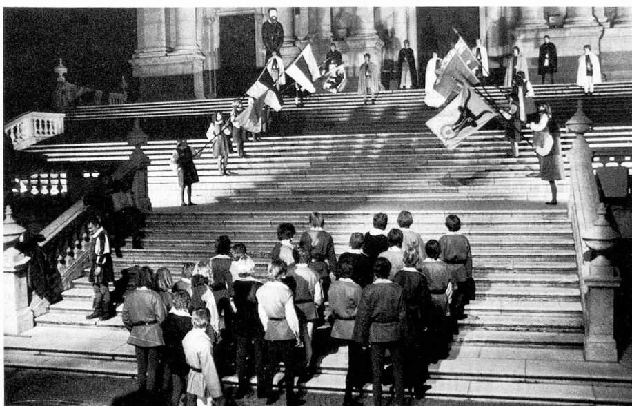
Représentation théâtrale sur le parvi de la cathédrale