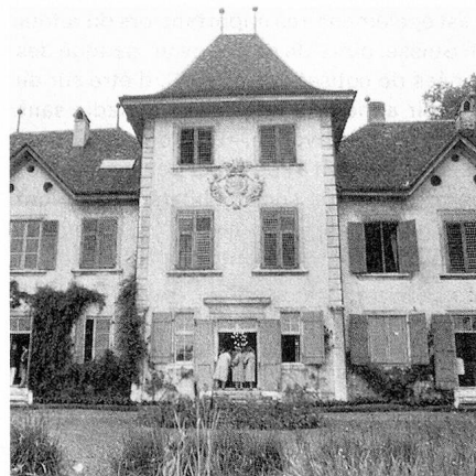
Vue du Château de Waldegg