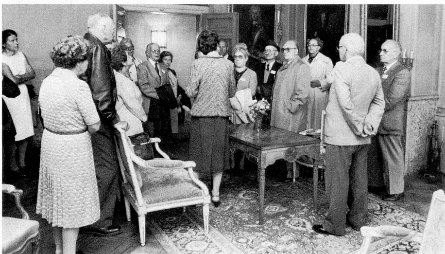
Visite du Château de Waldegg