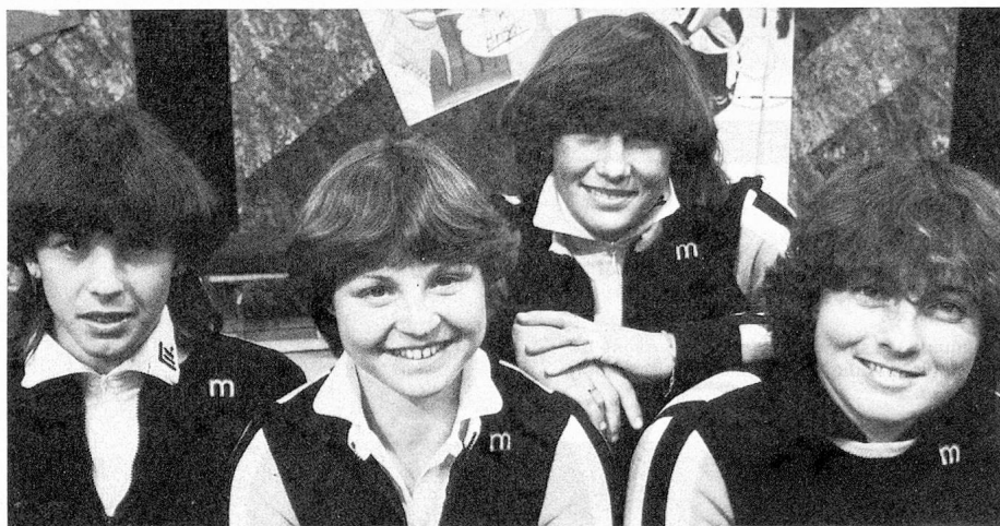
De g. à d. Doris de Agostini, Erika Hess, Maria Walliser et Marie-Thérèse Nadig.

Cette mignonne jeune fille de Mosnang dans le Toggenbourg qui vient de fêter ses 18 ans le 27 mai a disputé sa première saison entière en coupe du monde. Son succès a été éclatant. Elle a conquis ses premiers points dans la première compétition du Val d'Isère et à la fin de la saison cette spécialiste des courses à portes avait récolté des points dans toutes les disciplines et était la nouvelle venue de la saison la plus couronnée de succès. Pétillante d'ambition et de plaisir à skier, Maria Walliser qui aime passionnément les chevaux et vient, malgré les fatigues de la compétition mondiale, de terminer son apprentissage de commerce avec la mention bien, nous expliquait: «Ce n'est que maintenant que j'ai vraiment