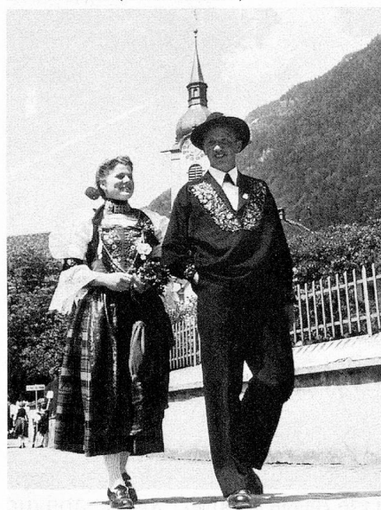
Couple en costume traditionnel du Canton de Nidwald