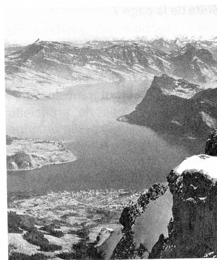
Vue sur le Bürgenstock et le lac des Quatre-Cantons

gemeinde». Chaque dernier dimanche d'avril elle est ouverte par les mots: «Getriiwi, liebi Landsliit» (chers et fidèles compatriotes). Cette réunion se tient à Wil an der Aa où l'on procède à l'examen et à la discussion des affaires canto-