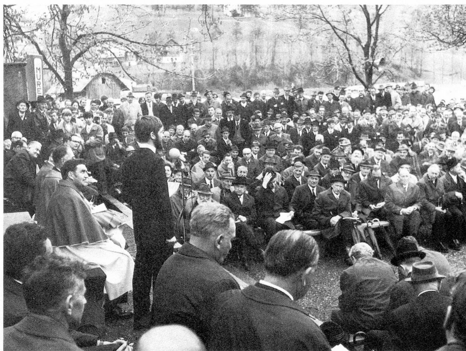
Landsgemeinde à Stans

du canton, ne reçoit pour ainsi dire pas de soleil durant les mois de décembre et de janvier.