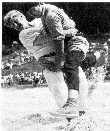
Un sport national, la lutte

aa) lorsque le mariage est dissous par le décès du mari, par une