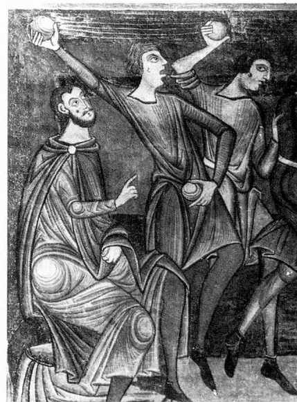
Peintures romanes dans l'abbatiale de Münstair.

Dans le domaine de l'assistance publique, la règle est que la Confédération ne vient en aide à un concitoyen double-national domicilié à l'étranger et tombé dans le besoin que lorsque c'est la nationalité suisse de l'intéressé qui prime. Mais c'est en premier lieu