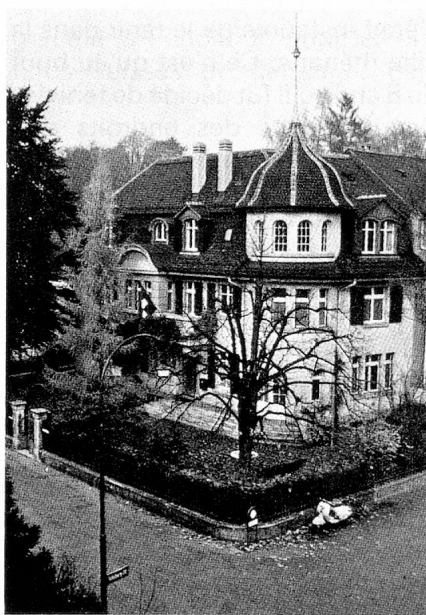
Siège du Secrétariat des Suisses de l'étranger

besoin d'un bureau faisant fonction d'organe exécutif et de liaison. On mit sur pied à cet effet en 1919 le Secrétariat des Suisses de l'étranger de la NSH, qui se révéla bientôt un instrument nécessaire et efficace. Son utilité apparut notamment lorsque les premiers Suisses chassés de la Russie en révolution affluèrent vers nos frontières et qu'il fallut pourvoir à leur réinstallation.