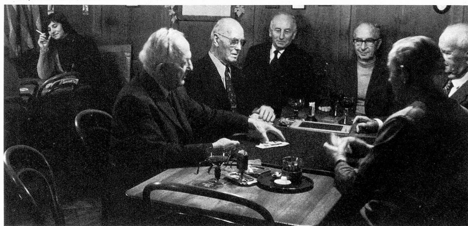
Une partie de Jass

L' Institut tropical suisse à Bâle ne manque pas d'intérêt pour les Suisses de l'étranger. Les émigrants peuvent y trouver informations et documentation. Une clinique spécialisée – qui n'est pas gratuite – lui est adjointe, elle peut donner des soins aux Suisses rapatriés souffrant de maladies tropicales.