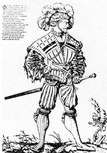
Capitaine suisse au service de France

Ouvrage traçant l'épopée du service étranger couvrant la période allant du Concile de Bâle