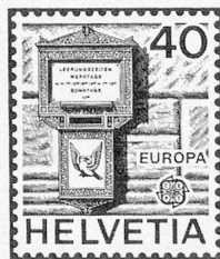
Historischer Briefkasten aus Basel Boîte aux lettres historique de Bâle Buca delle lettere storica di Basilea