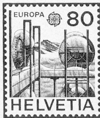
Alpine Relaisstation Jungfrau-Joch Station relais alpine du Jung- frau-Joch Ripetitore d'alta montagna dello Jungfrau-Joch

L'importation de billets de banque étrangers pour un montant dépassant fr. 20 000.- par personne et par trimestre est à nouveau libre depuis le 24 janvier 1979.