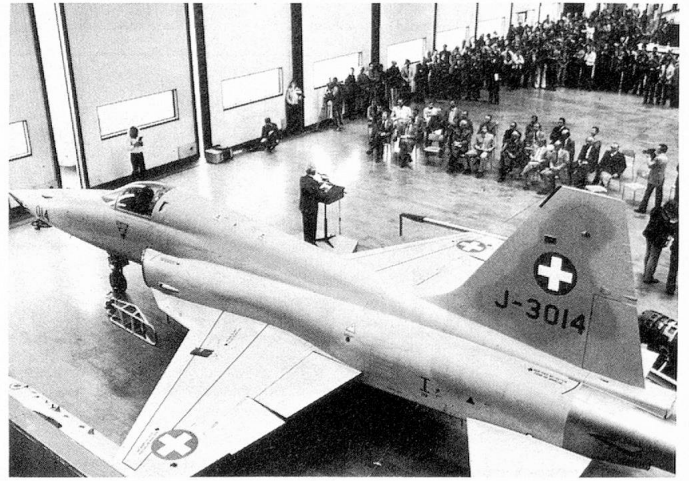
Les premiers avions de chasse Northrop F-5 «Tiger» viennent d'arriver en Suisse.