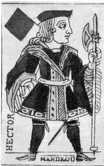
Carte à jouer de J.-J. Rousseau, tirée de la Revue neuchâteloise n° 51

Le jass est vraiment un jeu national dont les règles subissent de nombreuses interprétations locales. Naguère, les cafés affichaient un règlement anonyme parfois approuvé par une société cantonale de cafetiers, dans un endroit mal éclairé, difficilement accessible. Les jasseurs qui ont lu ces règlements sont une infime minorité, d'où cette floraison d'interprétations locales. Il existe de nombreuses conventions qui servent d'ententes entre partenaires, non enregistrées dans un règlement, quoique parfaitement correctes.