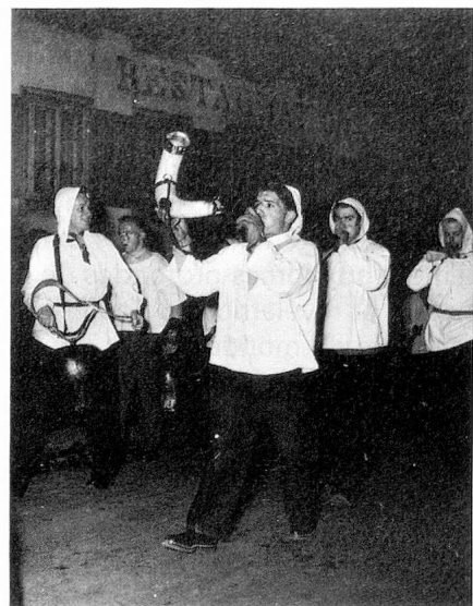
«Klausjagen», une vieille coutume de la Saint-Nicolas à Küssnacht