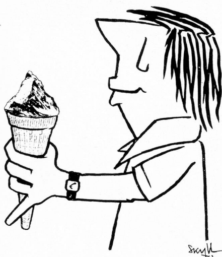
«Swiss ice cream»