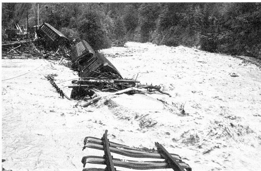
Accident ferroviaire près de Davos.

nant des mesures visant à combattre le fléchissement de l'emploi et des revenus. Il s'agit d'empêcher que les capacités de production de l'industrie de la construction ne tombent à un niveau inférieur aux besoins à long terme, d'aménager l'assurance-chômage et d'adapter la garantie contre les risques à l'exportation.