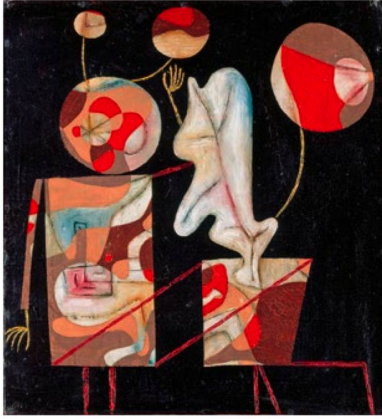
Paul Klee Marionettes, 1930 oil on cardboard