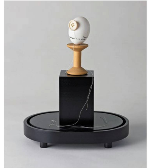
André Thomkins Knopfei, 1973 eggshell, button, thread spool and thread