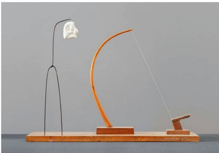
Alberto Giacometti Fleur en danger, 1932 wood, plaster, wire and string