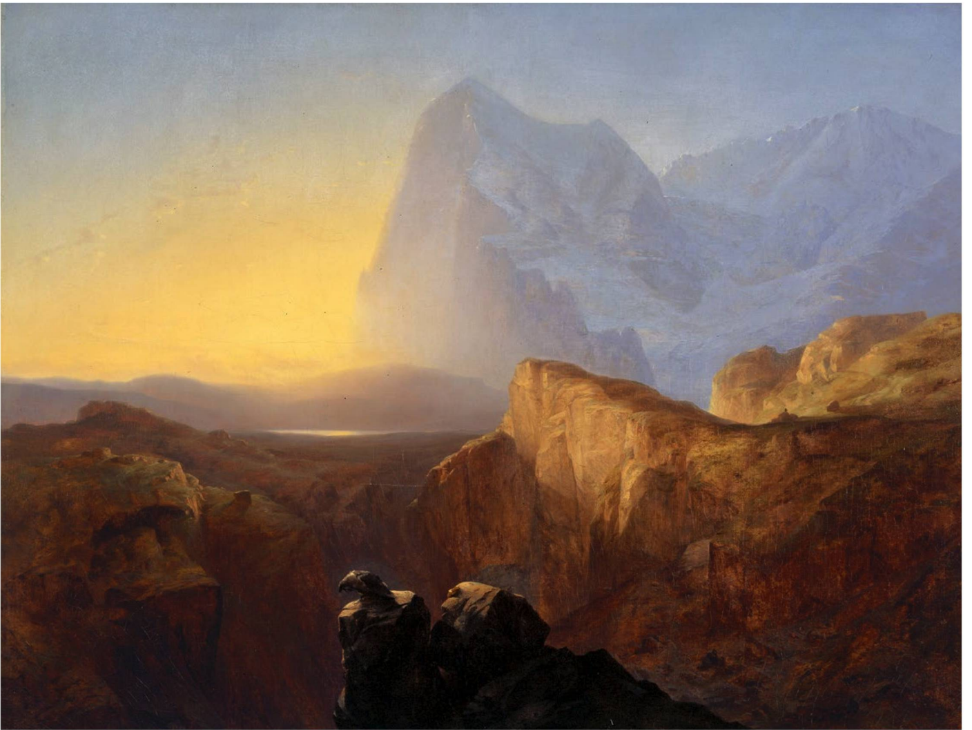
Alexandre Calame: "The Grand Eiger at Sunrise", 1844