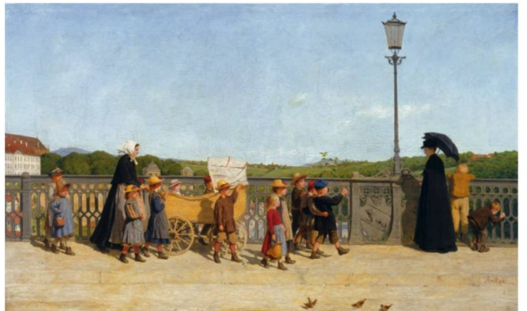
Albert Anker: "Infant School on the Kirchenfeld Bridge", 1900