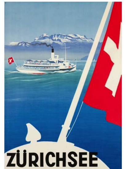
"Lake Zurich", 1935