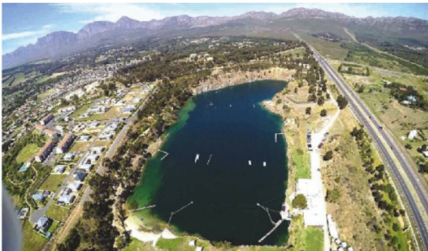
First multibillion Green Village

With Car Free Living at the core of our development, Blue Rock Village has one ring road serving the entire Village, leading cars through tree alleys with luxury paving and flower beds directly to the underground parking. This makes the Village entirely pedestrian and child-friendly and the green, landscaped can be enjoyed at leisure by all. To encourage residents to make use of alternative transportation, Blue Rock Village plans to motivate the City of Cape Town to extend the MyCiti Bus service to be in close proximity of the Village. The bus service will run on the proposed Bloubos Road, which connects from the N2, passes the Village to Somerset West.