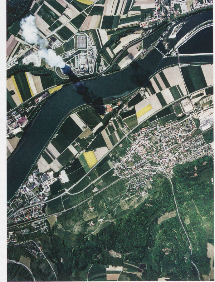
The Aare and the Leibstadt nuclear power station, 1991