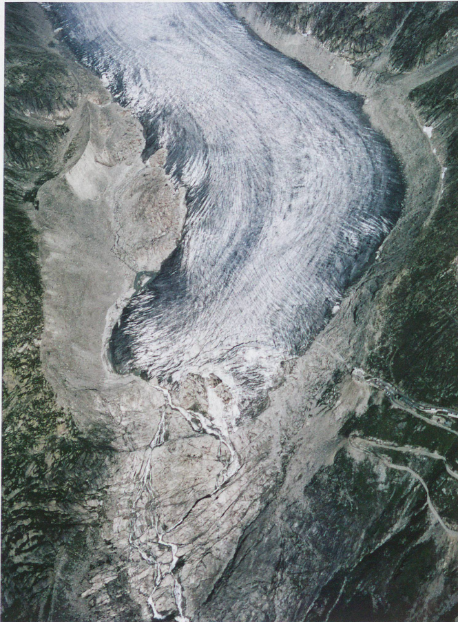
The ice tongue of the Rhone glacier and the Furka Pass road, September 1973