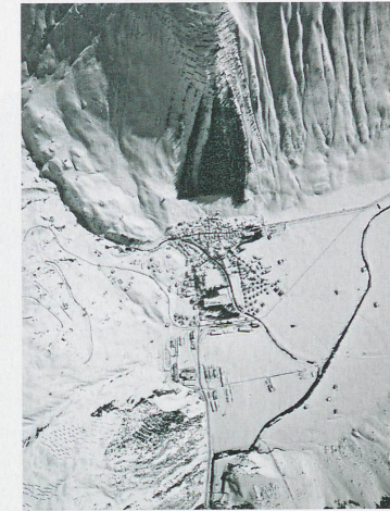
Bannwald near Andermatt, 1968