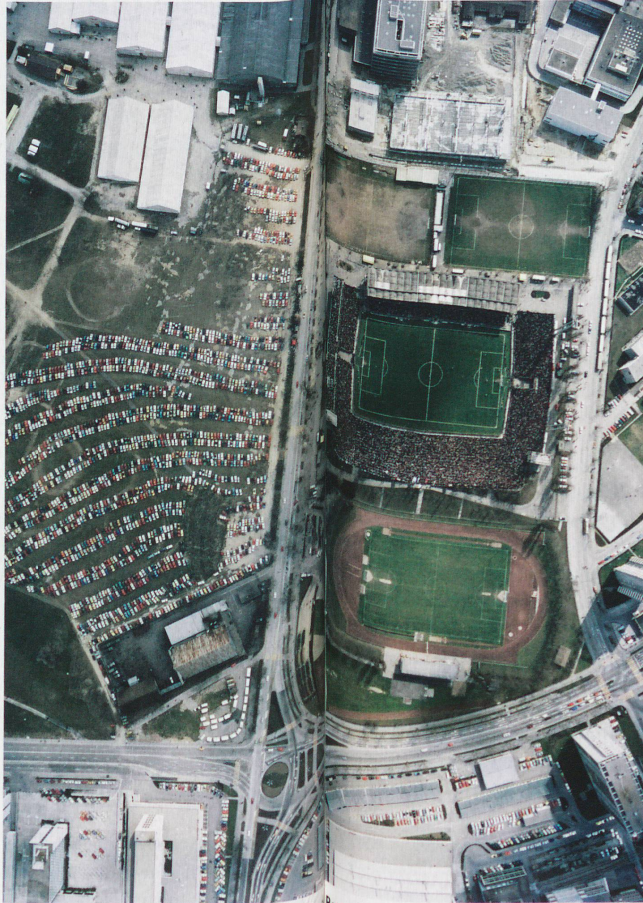
Cup final on Easter Monday at the Wankdorfstadion Bern, 1973