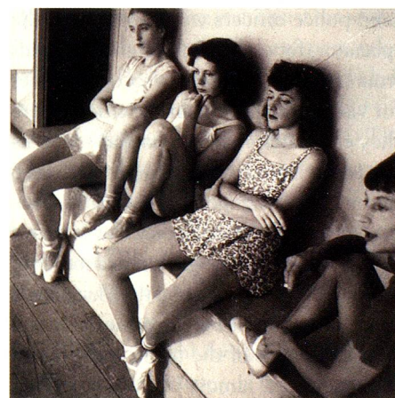
Dancers, Geneva, 1941