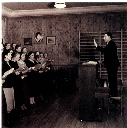
Choir practice, Zuoz, 1939