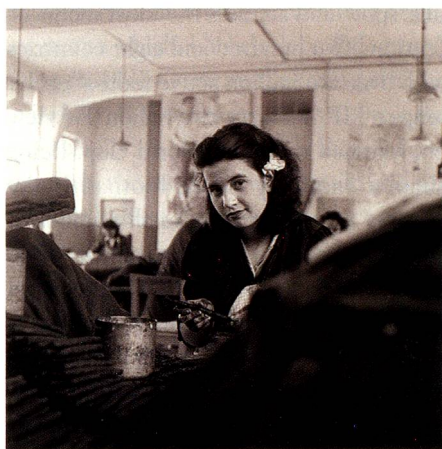
Tobacco worker, Brissago, 1947