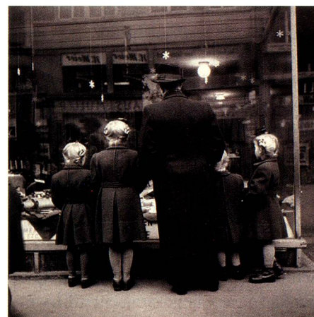
Third Sunday of Advent, Zurich, 1948