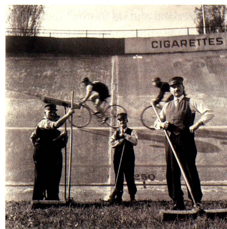
Bicycle racecourse, Zurich-Oerlikon, 1930s