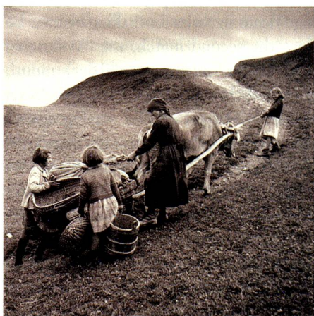
Potato load in Obersaxen, Platenga GR, 1948