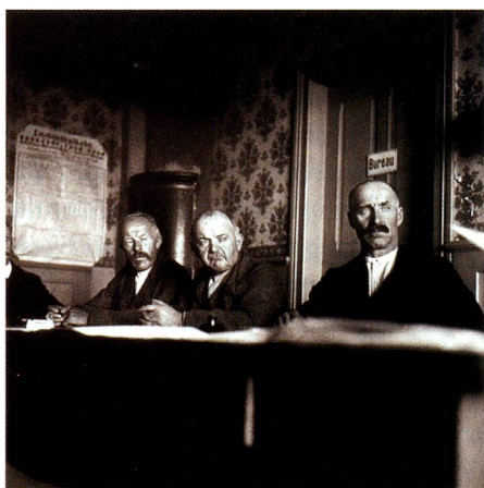
Municipal councillors in Ruederswil, 1938