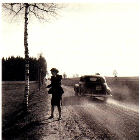
Traffic, Canton of Zurich, around 1949