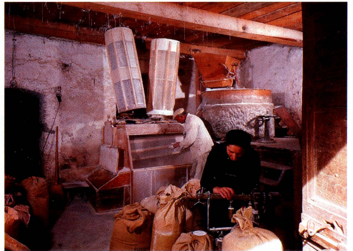
A corn mill in Poschiavo.