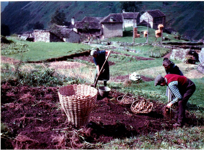
Picking potatoes in Mabraglia.

Alpine life. Back in the 1950s, Peter Ammon (born 1924) became one of the first Swiss photographers to produce large-format colour photographs. 25 years old at the time, he was fascinated by Swiss alpine life. The 125 photographs published for the first time in this book illustrate aspects of Switzerland in a way in which they have seldom been documented. The book costs CHF 78 and is available in all four national languages. www.aura.ch