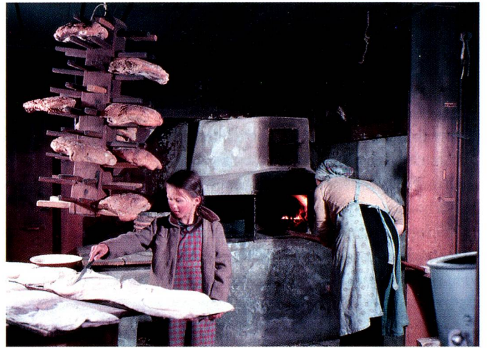
Baking bread in Lugnez.