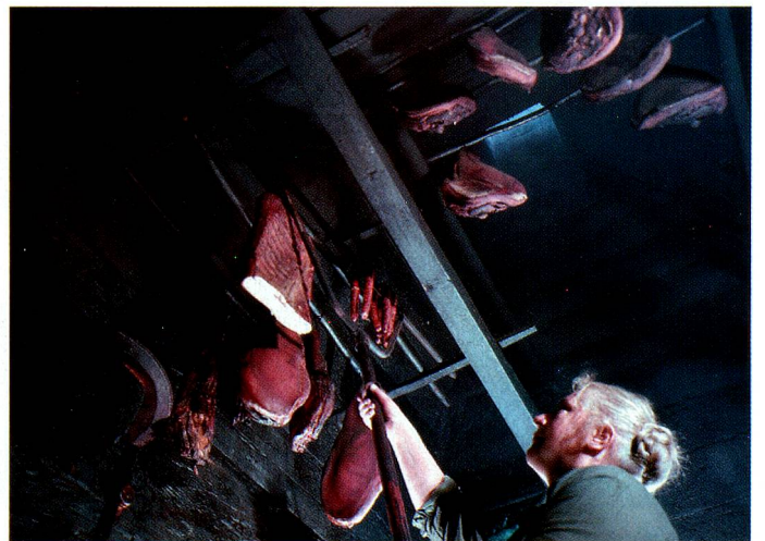
A "Burgundy fireplace" in Val d'Illier.