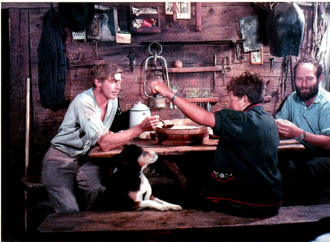
Drinking Suifi (a traditional whey drink) on Alp Gummez in Nidwalden.