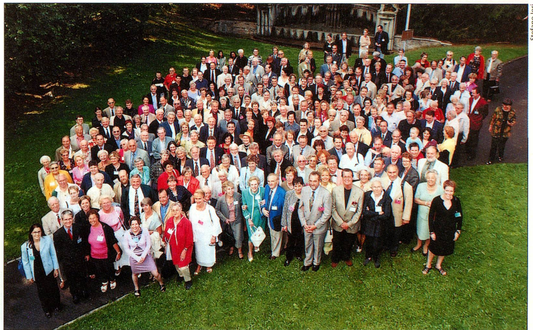
Joyeux congressistes à Davos.