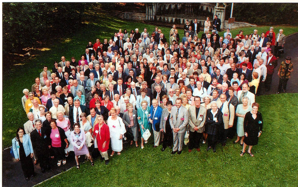
Joyeux congressistes à Davos.