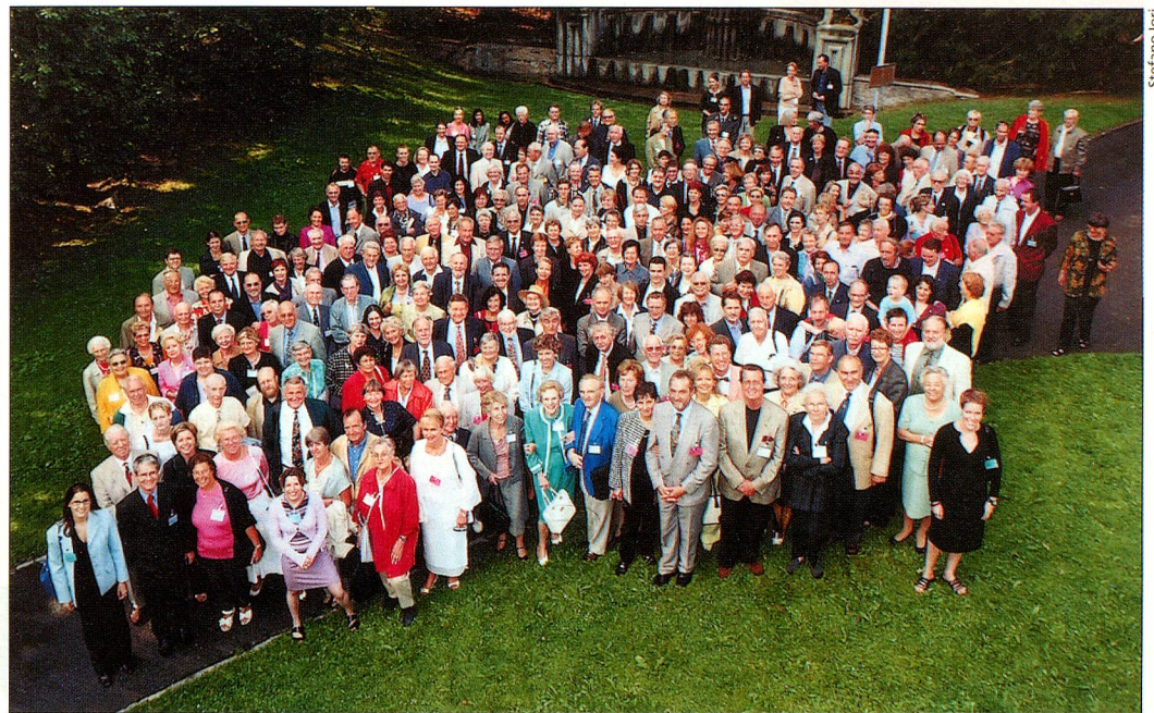
Joyeux congressistes à Davos.