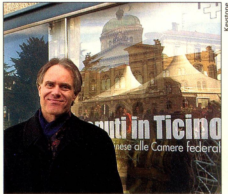
Federal President Moritz Leuenberger in Lugano.

But the business trip to Lugano did not just consist of excursions and social functions: the houses of parliament finally approved a revision of the penal code on abortion. Taking the reservations of the Christian Democrats (CVP) into account, the solution approved by both houses permits abortions within the first 12 weeks of pregnancy. But the CVP, supported by parts