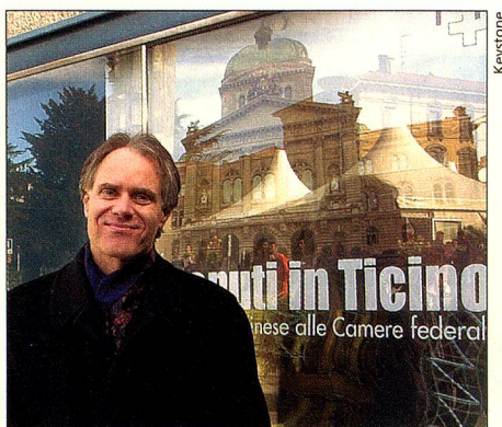
Federal President Moritz Leuenberger in Lugano.

But the business trip to Lugano did not just consist of excursions and social functions: the houses of parliament finally approved a revision of the penal code on abortion. Taking the reservations of the Christian Democrats (CVP) into account, the solution approved by both houses permits abortions within the first 12 weeks of pregnancy. But the CVP, supported by parts