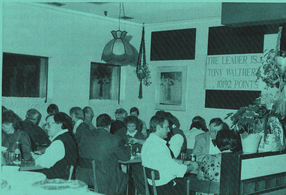
Swiss Club Jass Section at Peter & Paul's Restaurant, January 9, 1988

The Jass Section of the Swiss Club Toronto started their 14th Season on October 17/1987 with 40 players at the starting gate which is an «ideal number», since four