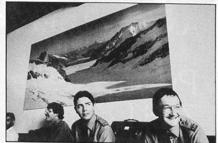
Arrival at the railway station