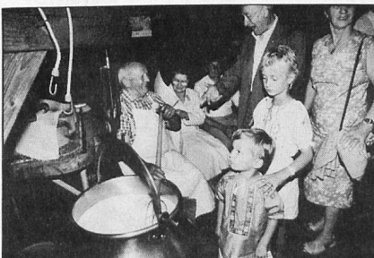
New participants watching how cheese is made