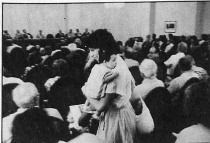
The youngest Swiss abroad