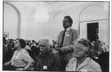
A keen questioner