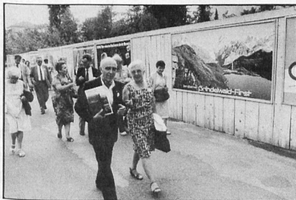
A walk in the village