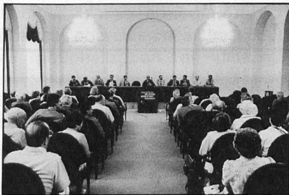
Question time at the Guisan Hall