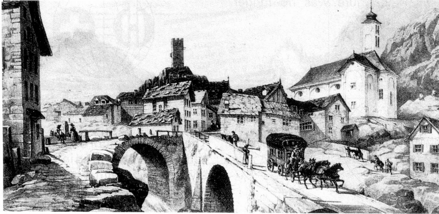
The mail-coach of the St-Gothard passing the village of Hospental.

«Saint-Gothard - VIA HELVETICA» by Arthur Wyss, Curator of the PTT-Museum in Berne.