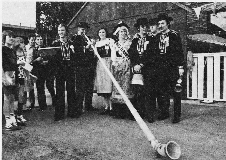
The Swiss Yodlers Toronto welcome visitors to the Pavilion.

Metro International Caravan, Toronto's salute to its ethnic community, celebrates its 10th Anniversary this year, from June 23 to July 1.