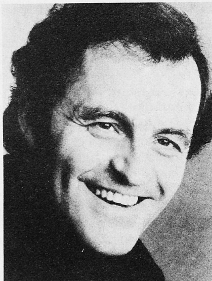
Charles Dutoit

Le Comité a nommé notre éminent compatriote membre d'honneur de