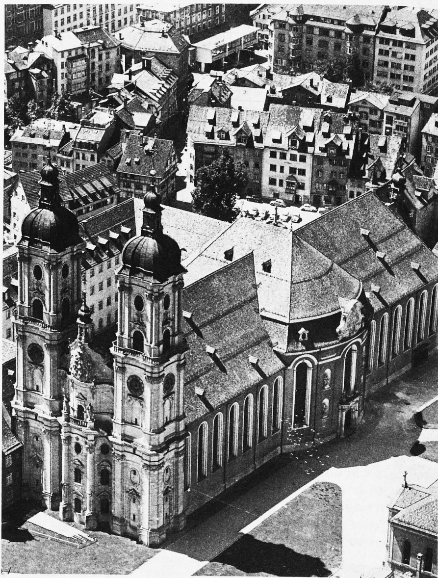
St. Gall's Baroque Cathedral