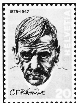
Charles Ferdinand Ramuz 1878-1947 Ecrivain