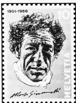
Alberto Giacometti 1901-1966 Peintre et sculpteur