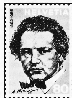
Arthur Honegger 1892-1955 Compositeur