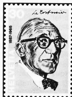
Le Corbusier Ch. Ed. Jeanneret 1887-1965 Architecte et peintre