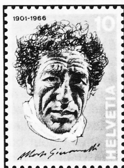
Alberto Giacometti 1901-1966 Peintre et sculpteur