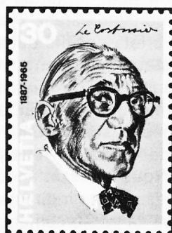
Le Corbusier Ch. Ed. Jeanneret 1887-1965 Architecte et peintre