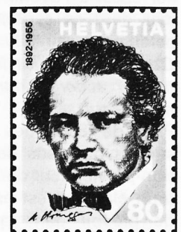
Arthur Honegger 1892-1955 Compositeur