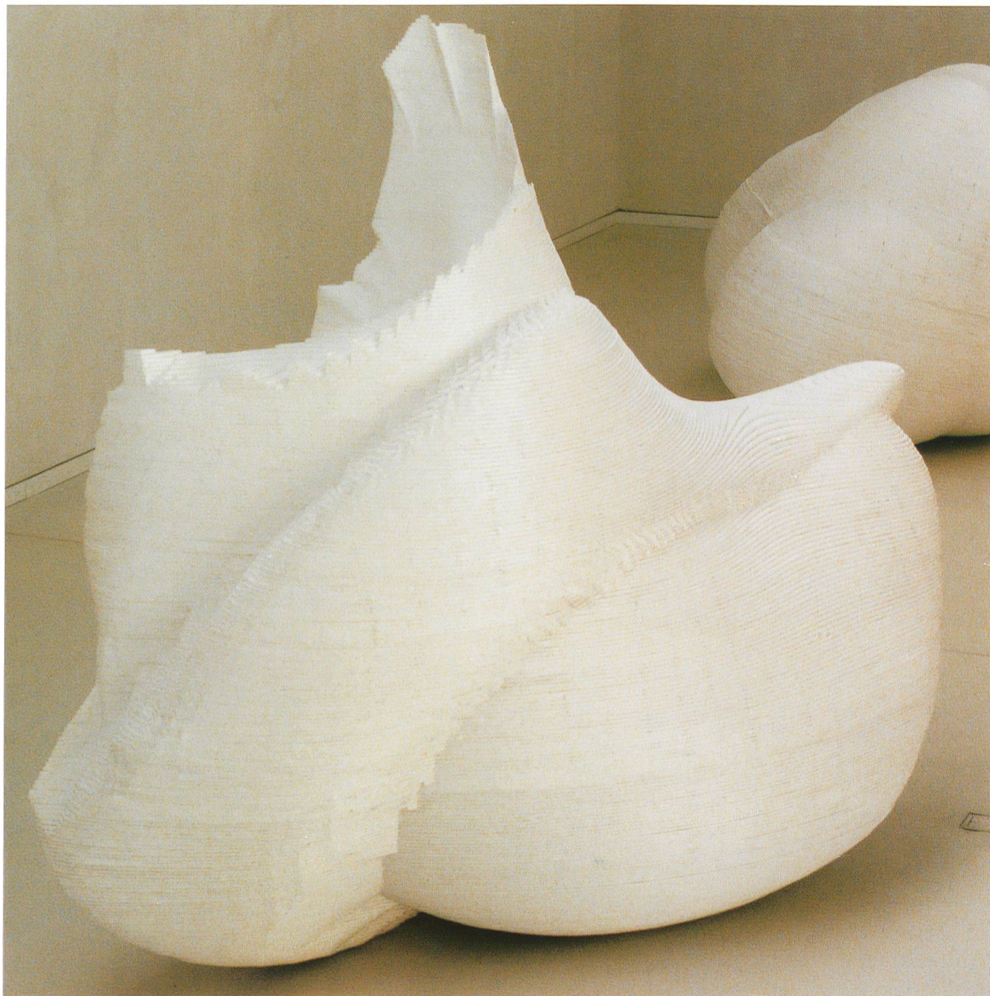
Seele S. R., Polystyren, 1997 280 × 130 × 240 cm