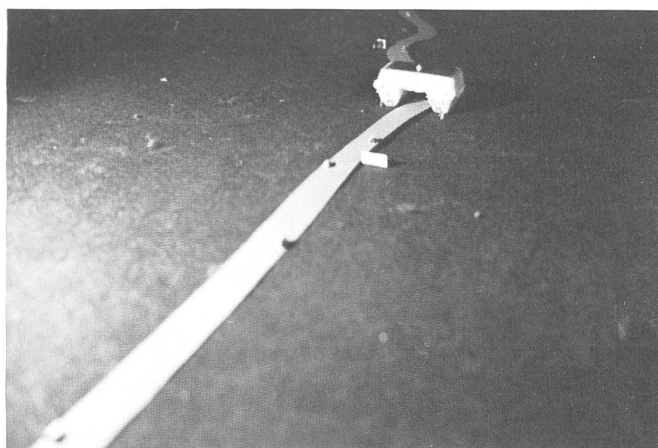
« Pavesi » de la « Wurstserie » (Série de saucisses), 1979, 10 photos ; ed. Stähli, Zürich (Ed. 12 Ex.)