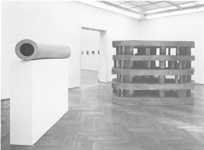
de g. à dr. : « Röhre » (Tube), 1985 polyuréthane, 170 × 40 cm (Ø) ; « Casa metafisica e di speculazione », 1985, polyuréthane, 190 × 250 × 200 cm (Vue de l'exposition à la Kunsthalle de Bâle)