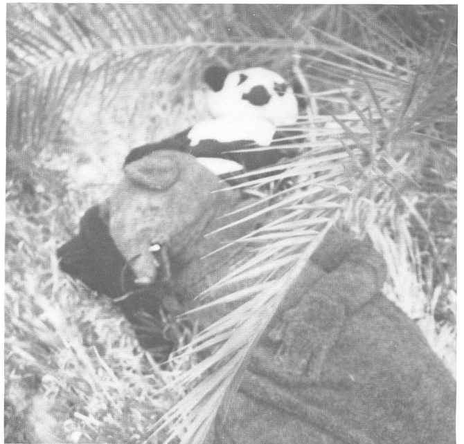
« Drehpause » (une pause durant le tournage)